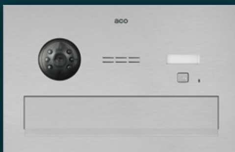
Skrzynka na listy z wideofonem COMO-PRO-POST-V1

W wersji V1 doskonały obraz także w nocy, dzięki nocnemu podświetleniu LED w podczerwieni