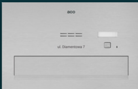
Skrzynka na listy z domofonem COMO-PRO-POST-A1

W wersji V1 kolorowa kamera o wysokiej rozdzielczości, z szerokokątnym obiektywem 2,8 mm o regulowanej pozycji kierunku obserwacji ( \pm 20^\circ w każdą ze stron)